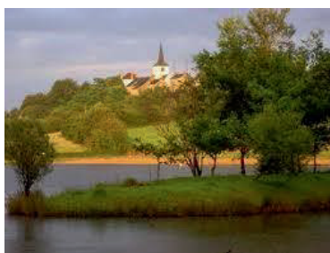
Village de Montapas et son étang